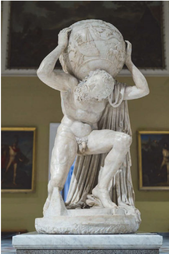
Abb. 1: Atlas Farnese, 2. Jh. n. Chr. Archäologisches Nationalmuseum Neapel.

mehr dazu, den Menschen den Kosmos zu erklären. Einer der Jupitermonde erhielt den Namen Kallisto. Dabei übersah man oder nahm zumindest keine Rücksicht darauf, dass Kallisto den Weg zu den Sternen eigentlich bereits Jahrtausende früher gefunden hatte. Bildliche und schriftliche Quellen der griechischen und der römischen Kultur legen Zeugnis ab von der verbreiteten Vorstellung des Himmels als eines Bereichs, in dem Gestalten des griechischen Mythos für den Menschen sichtbare Wirklichkeit werden.